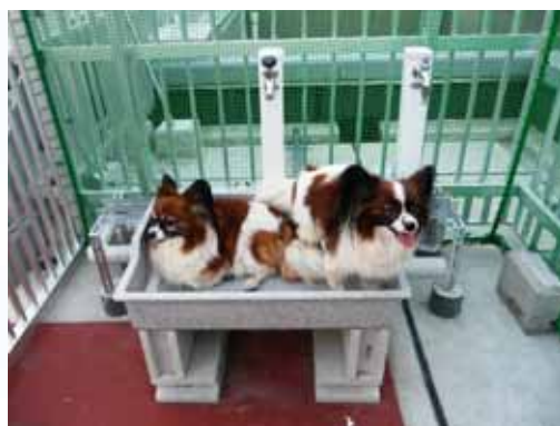
【ペット用足洗い場】