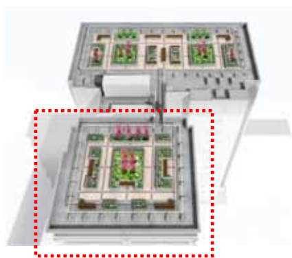
【ドッグランエリア】